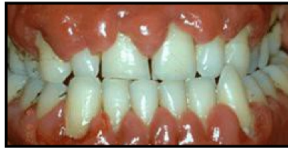
Genç bir diyabetik hastada dişeti iltihabı

4-Diyabetli hastalar tükürüklerindeki şeker nedeniyle ağızda mantar enfeksiyonlarına açıktır. Bu sorunun, dudakların birleşim yerinde çatlak ve kızarıklıklar halinde kendini belli eder. Sigara kullanımı ve protezlerin gece ağızdan çıkarılmaması mantar gelişimini hızlandırabilir. Ağızda mantar enfeksiyonunun tedavisinde ilaçlardan faydalanılır. Protezlerin temizliğine dikkat edilmeli ve geceleri de mutlaka çıkarılmalıdır. Sigara kullanılmamalıdır