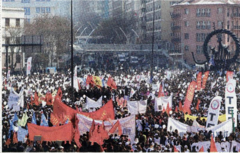
Sağlıkçıların Ankara Sıhhiye Meydanı'nda yaptığı eyleme CHP, ÖDP, TKP gibi partiler de destek verdi.