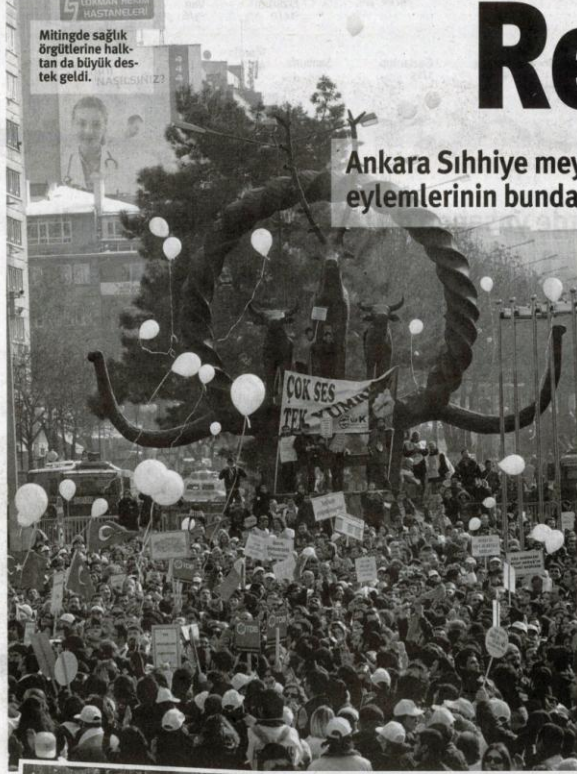
Mitingde sađlık örgütlerine halktan da büyük destek geldi.

Ankara Sıhhiye meydanını beyaza boyayan 30 bin sađlık emekçisi eylemlerinin bundan sonraki adımının iş bırakma olduğunu söyledi