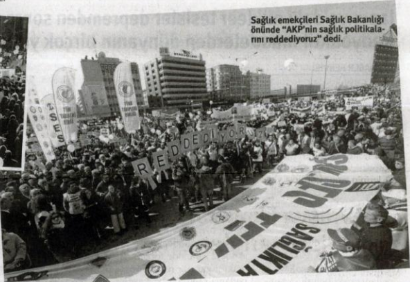
Sađlık emekçileri Sađlık Bakanlıđı önünde "AKP'nin sađlık politikalarını reddediyoruz" dedi.

Ankara Sıhhiye meydanındaki mitinge İşçi Partisi, TKP ve ÖDP'nin yanı sıra Galatasaray "Tek Yumruk" taraftar grubu ve Ankaragücü taraftarları da destek verdi. Galatasaray ve Ankaragücü taraftarlarının şarkılı sloganları büyük alkış aldı. Mitingde sık sık "Günde 2 kere AKP'yi fırçala", "Sermayeyi deđil halkı ko-nyun", "Hükümet istifaya Tayyip yüce divana", "Parasız eğitim parasız sađlık", "Gün gelecek devran dönecek, AKP halka hesap verecek" sloganları atıldı.