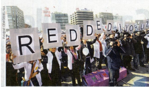
Türkiye'nin dört bir yanından Ankara'ya gelen binlerce doktor, sağlık politikalarını protesto etti.