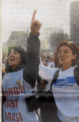
Sağlık çalışanları, hükümetin sağlık politikasını düdüklü çalarak ve slogan atarak protesto etti...

"Taşeronla başkaldırıyoruz", "Sağlıkta ticaret ölüm demektir", "Sağlık haktır" ve "Sağlıkta dönüşüm yalanına hayır" yazılı pankartlar açtı. Çalışma şartlarının iyileştirilmesi taleplerini dile getiren sloganlar atan sağlık çalışanları, kortejler halinde Sıhhiye Meydanı'na yürüdü. Mitingde, Ankara Emniyet Müdürlüğü'nde çeşitli şubelerde çalışan 2 bin 695 polis görev yaptı. Mitinge katılan yaklaşık 20 bin kişi, Sıhhiye Meydanı'nın çevresinde oluşturulan polis noktalarda üzeri arandıktan sonra miting alanına alındı. CHP Genel Başkan Yardımcısı Umur Oran ve Bayram Meral ile Oğuz Oyan, Sacid Yıldız ve Ali Rıza Öztürk'ün de aralarında olduğu bazı CHP milletvekilleri de mitinge katılarak sağlık çalışanlarına destek verdi.