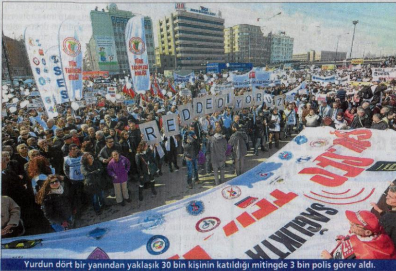
Yurdun dört bir yanından yaklaşık 30 bin kişinin katıldığı mitingde 3 bin polis görev aldı.