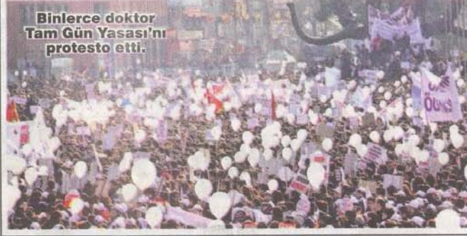
Binlerce doktor Tam Gün Yasası'nı protesto etti.

► SAĞLIK çalışanları 14 Mart Tıp Bayramı öncesi Ankara Sıhhiye Meydanı'ndaki "Çok Ses, Tek Yürek" mitinginde bir araya geldi. Binlerce sağlık çalışanı, taleplerini sıraladı. "Can güvenesi; gelir güvenesi; sağlık haktır; mesleki bağımsızlık; performansla hayır" dövizleri taşıyan sağlık çalışanları, Tam Gün Yasası'nı protesto etti.