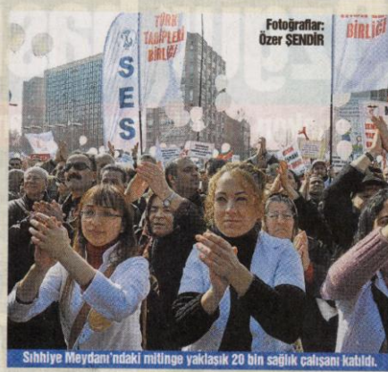
Sıhhiye Meydanı'ndaki mitinge yaklaşık 20 bin sağlık çalışanı katıldı.