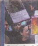
Basın özgür tutuklu mes!

me destek verdi. "Gazetecilere özgürlük, hemen şimdi", "Özgür basın varsa özgür toplum vardır" yazılı pankartların taşındığı eylemde, "Özgür basın, özgür toplum", "Çeteler dışarıda gazeteciler içeride", "Dokunan yansa da dokunacağız" sloganları atıldı. Tutuklu bulunan bazı gazetecilerin fotoğrafları da taşındı.