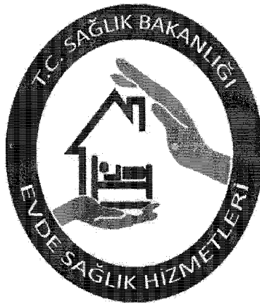
Şekil 2. Evde Sağlık Hizmetleri Logosu