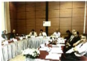
Sağlık İnsan Gücü Çalışma Grubu

Çalışma gruplarının hazırladıkları raporlar, tüm katılımcılara sunularak tartışılmıştır.