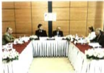
Tıbbi Cihazların Standardizasyonu Çalışma Grubu