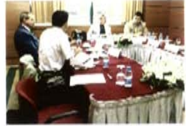
Hasta Hakları ve Hekim Sorumluluğu Çalışma Grubu