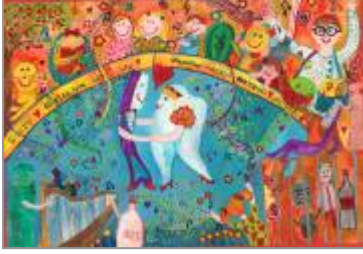
1.lik ödülü alan resim