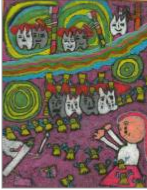
3.lük ödülü alan resim

Dereceye giren öğrencilerin ödülleri 30 Haziran 2008 tarihinde Yüzyıl Kongresinin Meslek Sorunları Sempozyumunda verildi.